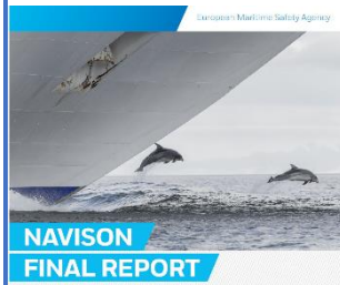
NAVISION FINAL REPORT